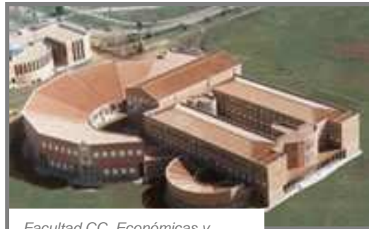
Facultad CC. Económicas y Empresariales. Vista exterior