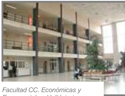
Facultad CC. Económicas y Empresariales. Hall Interior